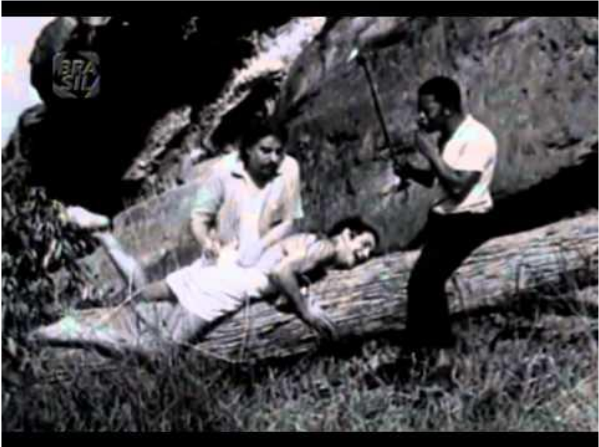
Imagem 5: fotograma do filme O Anjo Nasceu , de Júlio Bressane.

O capitalismo e sua mais forte expressão, a “economia de mercado”, partem de uma lógica puramente predadora, cujo discurso é abertamente falso: as necessidades de consumo são ilimitadas, frente aos recursos reais limitados; para isso, devemos desabrigar 5 , o tempo todo, recursos da natureza em nosso planeta. Surgem daí as formulações do artista carioca 6 frente à essa lógica de produção extensiva da economia de mercado, nenhuma delas satisfatória para ele: de um lado a “prisão de ventre”, ou seja, a negação do consumo; do outro, a “diarreia”, por conta de um excesso de