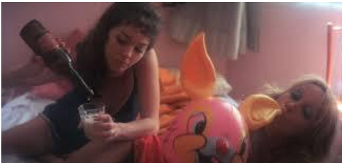
Imagem 1: fotograma do filme Copacabana Mon Amour de Rogério Sganzerla.

chamamos de imagens da subsistência – entendidas aqui como imagens que apenas sub-existem , ou seja, imagens abertas aos mais diversos devires, que nunca se conformarão inteiramente – exibidas pelos filmes do chamado Cinema Marginal e que só puderam realizar-se sob os auspícios da invenção de uma altermodernidade , um “terreno autônomo” (diríamos mesmo uma deriva da modernidade e dos modernismos em direção a uma alternativa) inventado, criado, por diversos realizadores desta época.