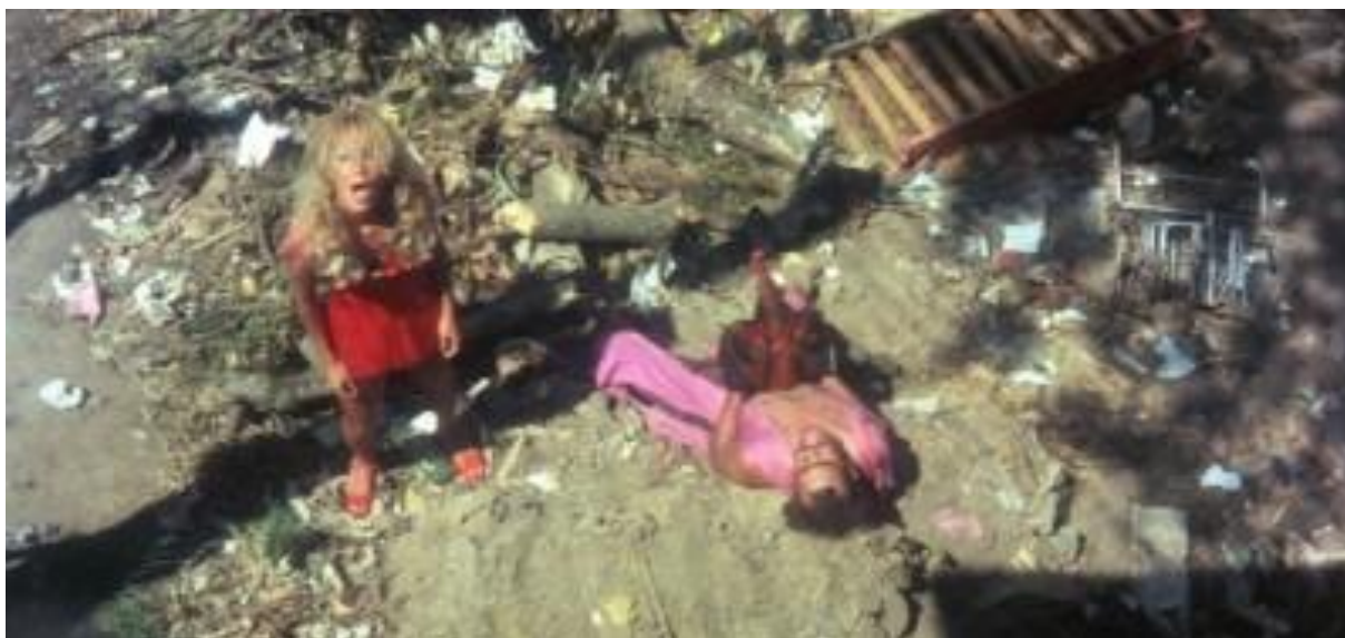
Imagem 4: Fotograma do filme Copacabana Mon Amour , de Rogério Sganzerla.

A partir daí abre-se para nós um campo inédito de investigação que contempla, em segundo plano, o papel do corpo na arte, a partir dos “seres” que habitam (mais do que propriamente atuam) este cinema como em nenhum outro: liga-los, principalmente, às artes visuais desta época, e buscar – em seu aparente inacabamento – exatamente aquilo que faz com que o Cinema Marginal ainda sobreviva como algo que dói, que insulta, mas que também nos surpreende e nos emociona. Esses sentimentos contraditórios suscitados pelos filmes marginais nada mais são do que a prova de sua sobrevivência no decorrer do tempo. De como essa sobrevivência se deu justamente por que os cineastas marginais nada mais fizeram do promover uma deriva, no sentido de uma fuga da modernidade como um campo de forças, mesmo que de maneira temporária, mas os filmes ficaram e ficam: é a “luz tremeluzente” desses filmes que teima em nunca se apagar.