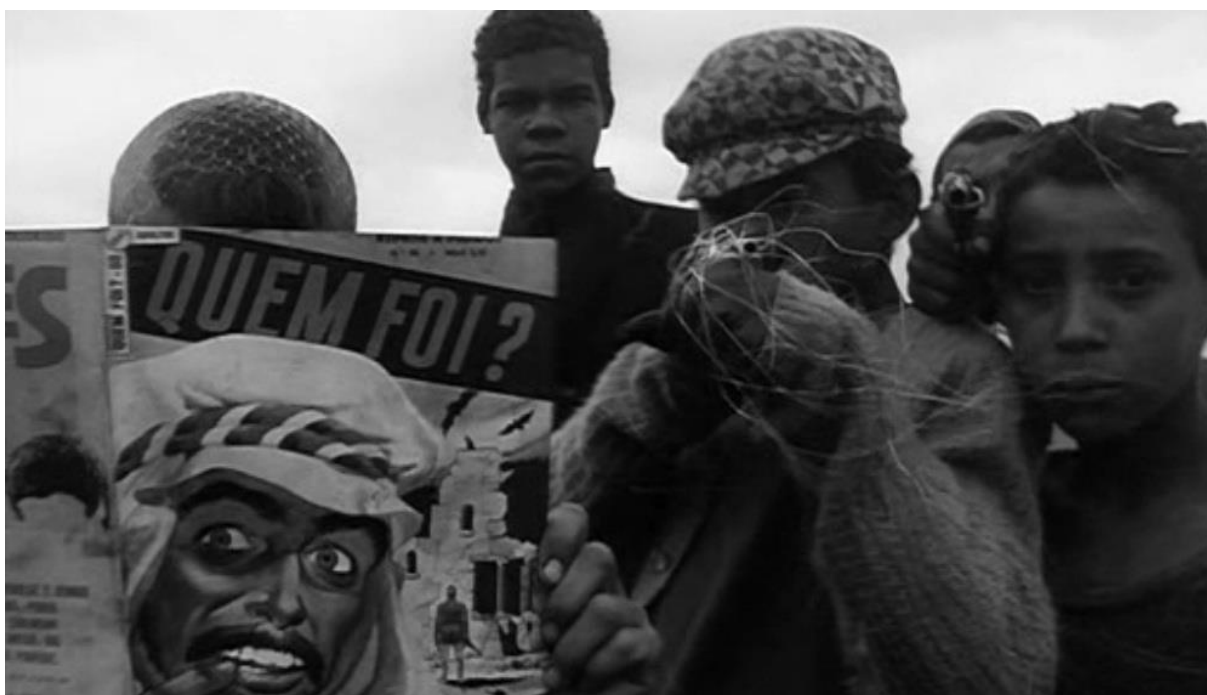
Imagem 2: fotograma do filme O Bandido da Luz Vermelha de Rogério Sganzerla.

Sabemos nós – que fizemos estes filmes feios e tristes, estes filmes gritados e desesperados onde nem sempre a razão falou mais alto – que a fome não será curada pelos planejamentos de gabinete e que os remendos do tecnicolor não escondem mas agravam seus tumores. Assim, somente uma cultura da fome, minando suas próprias estruturas, pode superar-se qualitativamente: e a mais nobre manifestação cultural da fome é a violência (ROCHA, 2004, p. 66)